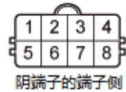
换档电磁阀线束 8 针连接器